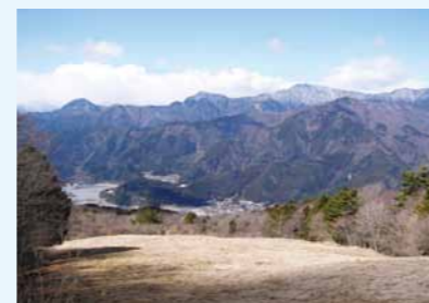
南アルプスがよく見えます(手前は井川湖)