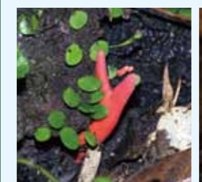
カエンダケ 有毒 さわると危険!