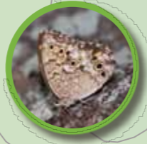
サトキマダラヒカゲ