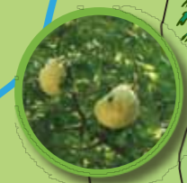
モリアオガエル卵塊