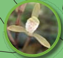
ウスキムヨウラン