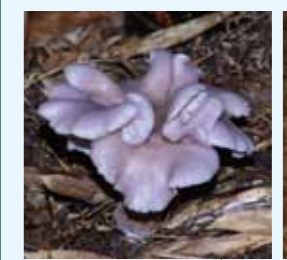
コムラサキシメジ