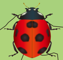
ナナホシテントウ